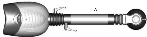
Verlengde arm bereik A = 697.5mm