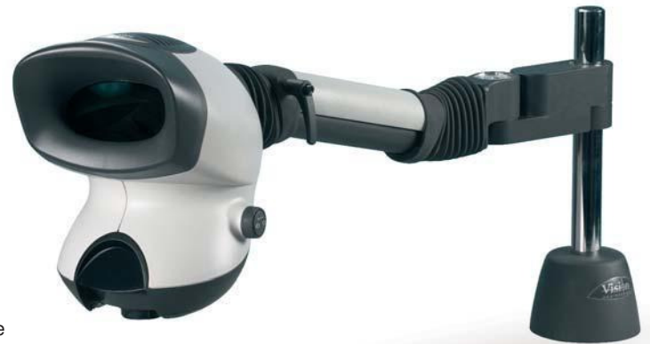
Mantis Compact, met verlengde arm en extra tussenstuk.

Alle Mantis toestellen zijn voorzien van een netstroom adapter van 9V DC